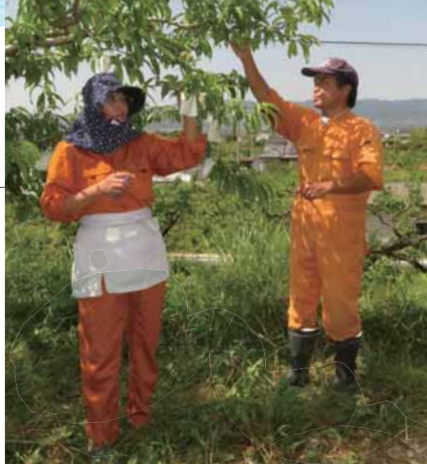
▲摘果や袋がけは桃栽培でかかせない