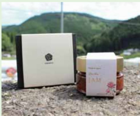
▶ 3品種のバラのジャム