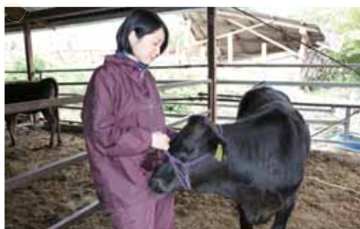
▲子牛の飼育は気を付けることがたくさん

を使い、1頭1頭決まった量が行き渡るよう調節しながら与えるので、餌やりに2時間近くかかるという。 「日々の観察、体調管理、感染症の予防など、基本的なことを徹底し、自分が納得して出荷できる様に育てたい」と今後の意気込みを語る。