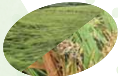
▲ 風水害・雨害湿潤害 台風10号による倒伏・穂発芽