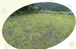
▲ 獣害 イノシシによる踏み荒らし