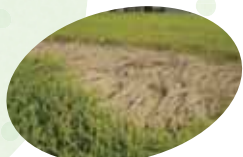
▲ 虫害 トビロウuncaによる坪枯れ